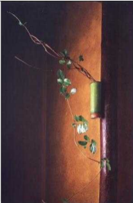
Eine Blumenvase bringt sich in den Raum