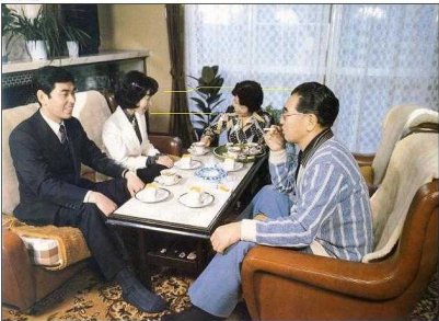
Die Gastgeberin kniet am Boden. Kopf und Schultern sind niedrig.