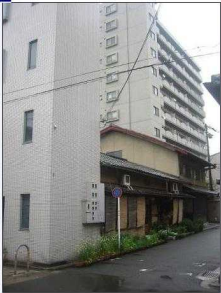
Japanisches Haus (Kyoto)