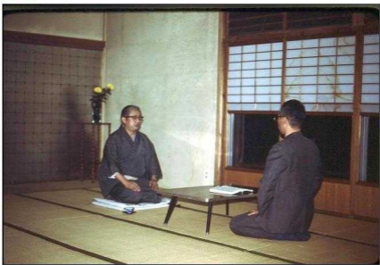
Menschen im japanischen Raum