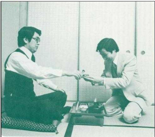
上役や先輩には、まず「お流れを頂いて…」から