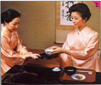
darbringen und entgegennehmen