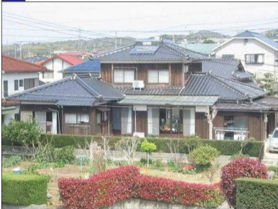
Japanisches Haus (Ube)